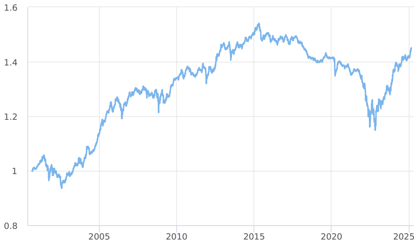
— Amundi CR Balancovaný - konzervativní