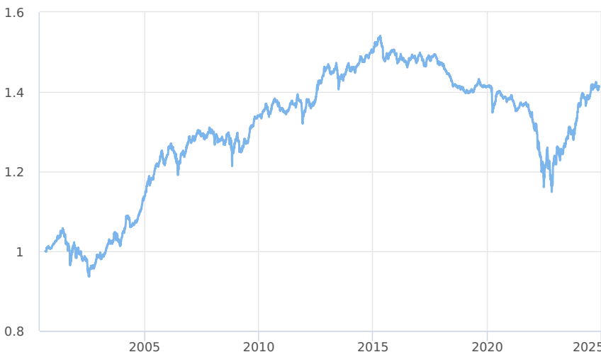
— Amundi CR Balancovaný - konzervativní