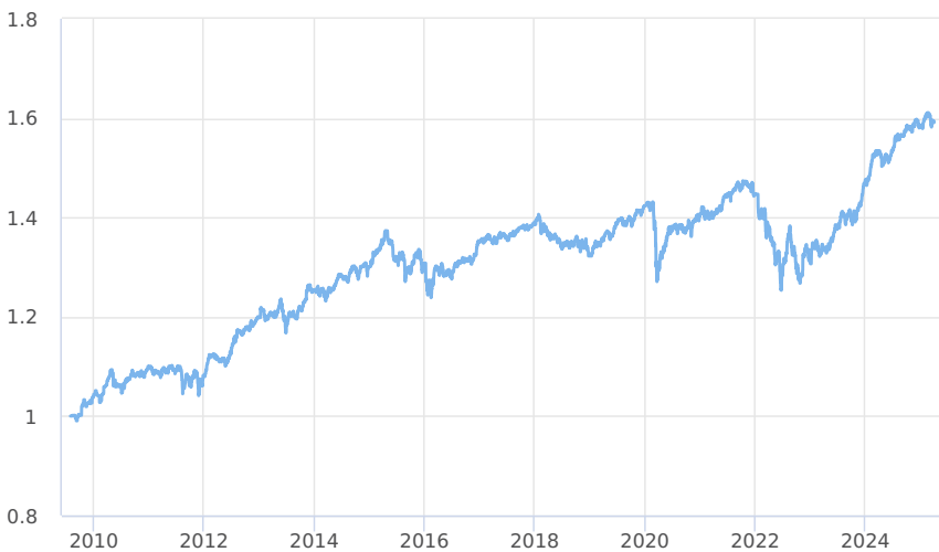
— KB Portfolio - Konzervativní