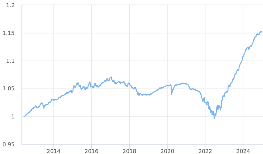
— KB Portfolio - Rezerva (KB PSA 1 - Úroková)