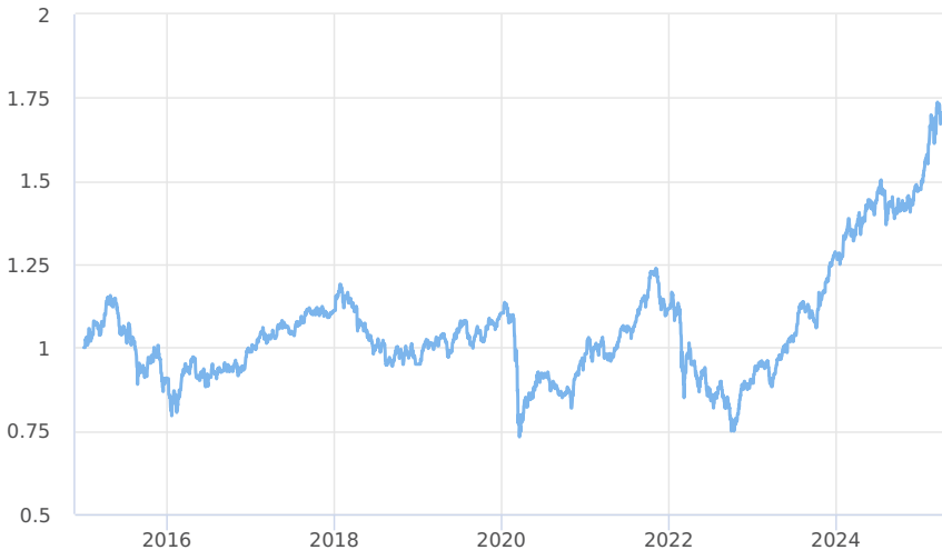
— Amundi CR Akciový - Střední a východní Evropa - třída A