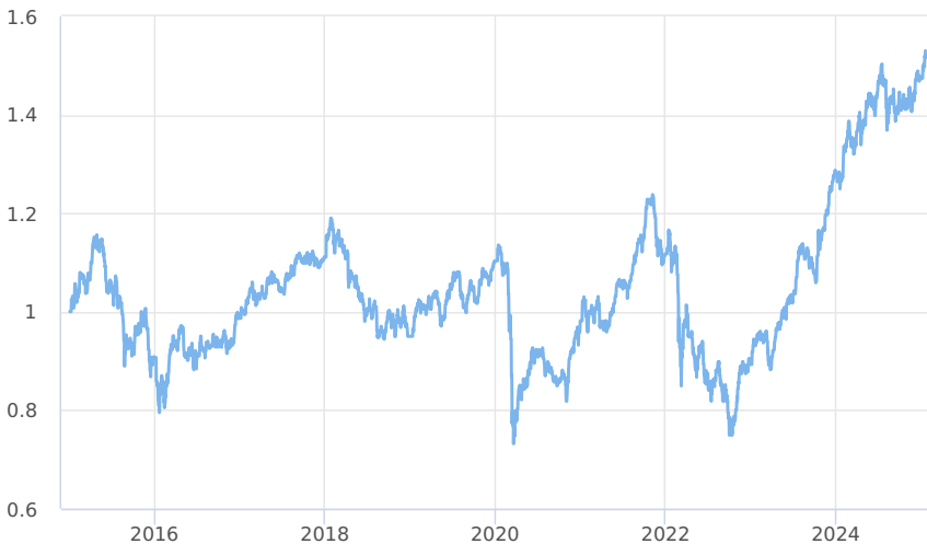
— Amundi CR Akciový - Střední a východní Evropa - třída A