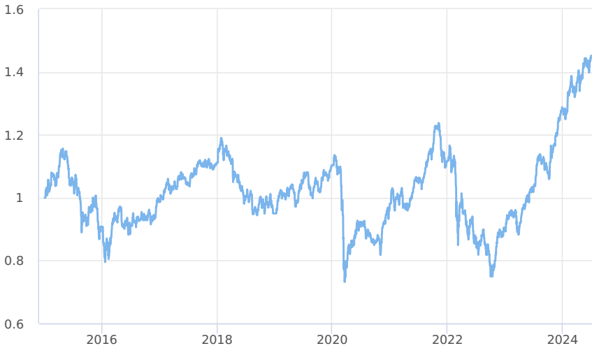
— Amundi CR Akciový - Střední a východní Evropa - třída A