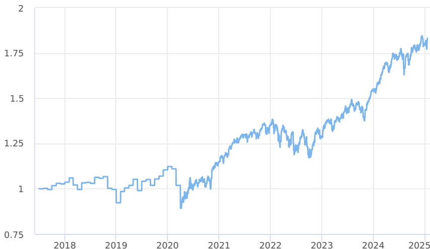
— KBPB Equity Strategy - TŘÍDA PREMIUM