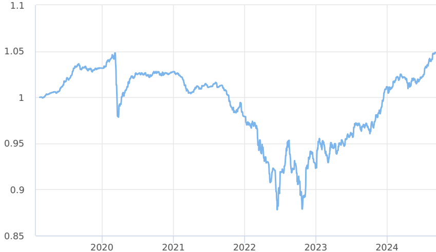
— Amundi CR IM Dluhopisový (fond byl uzavřen 31.12.2024)