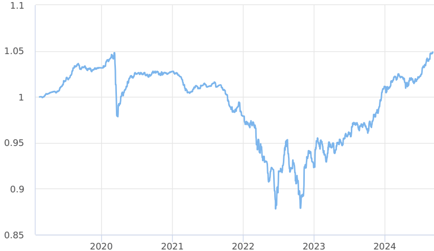
— Amundi CR IM Dluhopisový (fond byl uzavřen 31.12.2024)