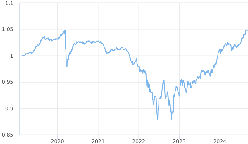
— Amundi CR IM Dluhopisový (fond byl uzavřen 31.12.2024)