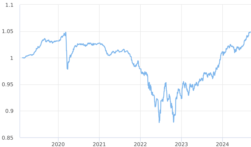
— Amundi CR IM Dluhopisový (fond končí k 30.11.2024)