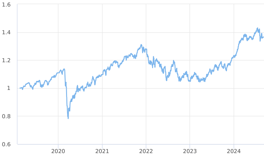
— Amundi CR IM Akciový (fond končí k 30.11.2024)