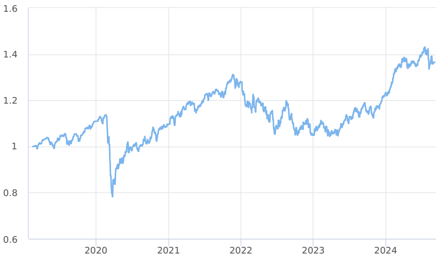
— Amundi CR IM Akciový (fond byl uzavřen 31.12.2024)