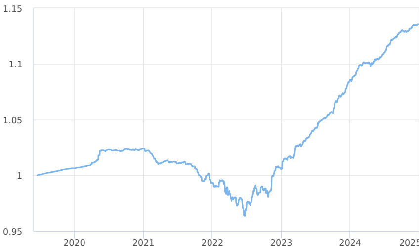
— Amundi CR Privátní fond úrokových výnosů