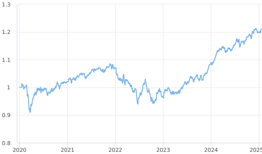
— Amundi CR Balancovaný