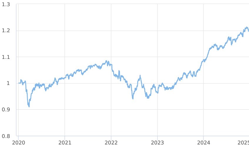
— Amundi CR Balancovaný