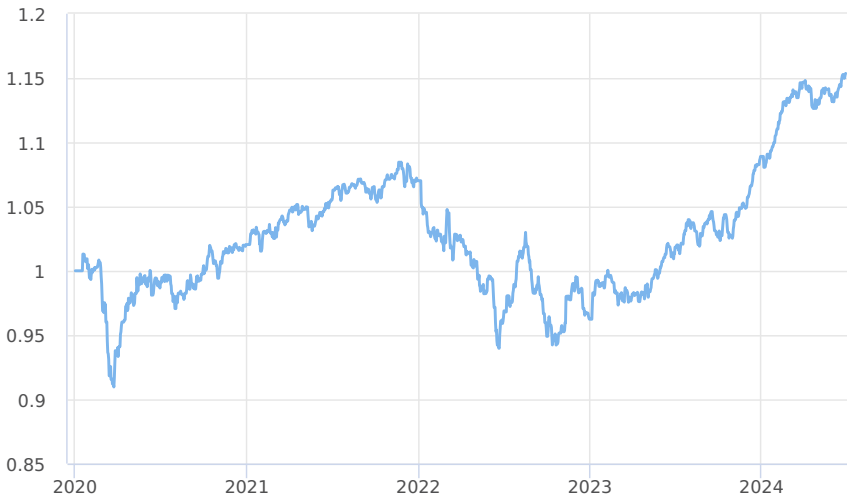
— Amundi CR Balancovaný