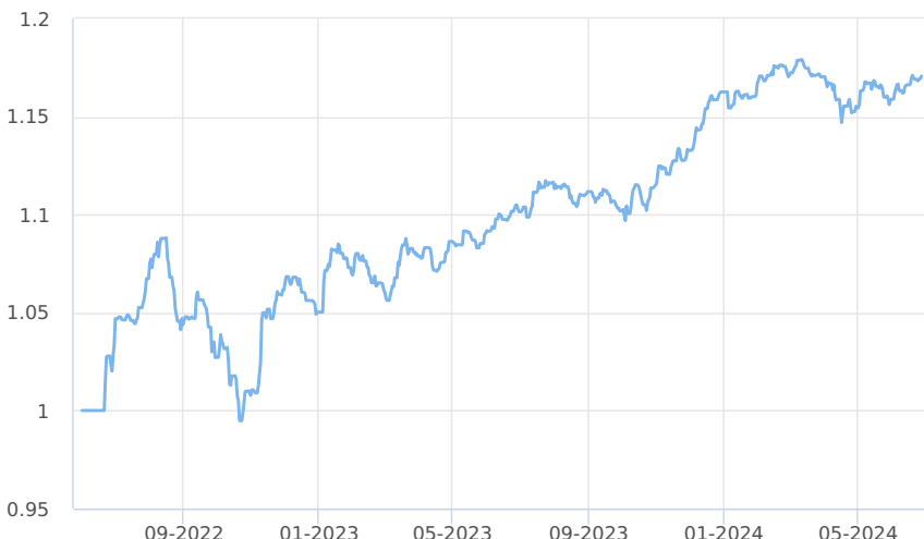
— Amundi CR - obligacní fond (třída M)