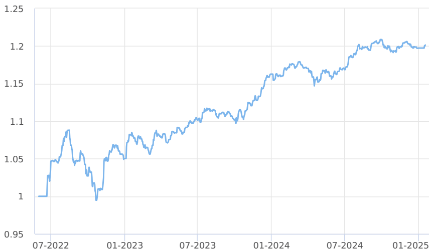
— Amundi CR - obligacní fond (třída M)