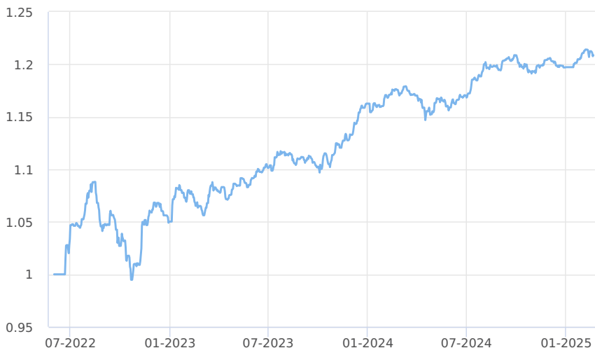
— Amundi CR - obligační fond (třída M)