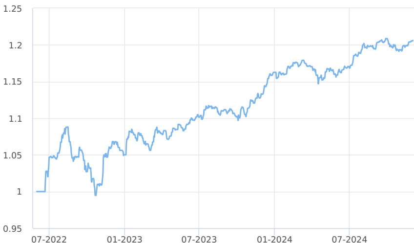
— Amundi CR - obligační fond (třída M)