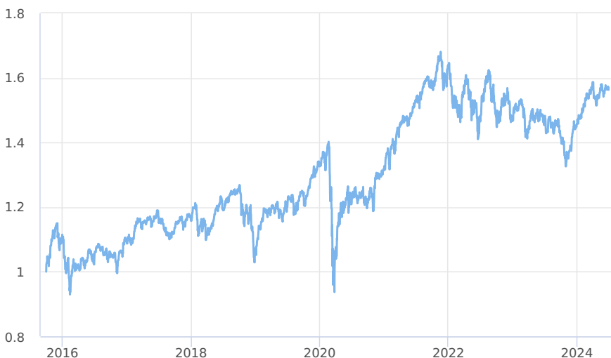
— CPR Global Silver Age