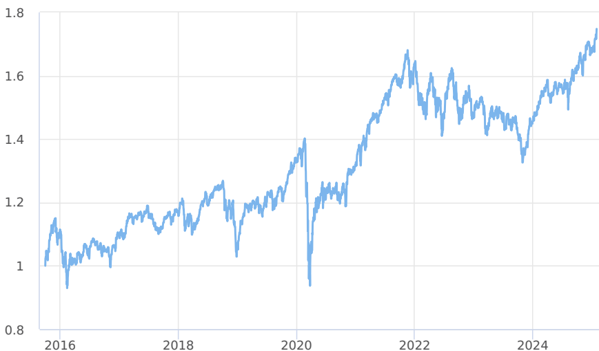
— CPR Global Silver Age