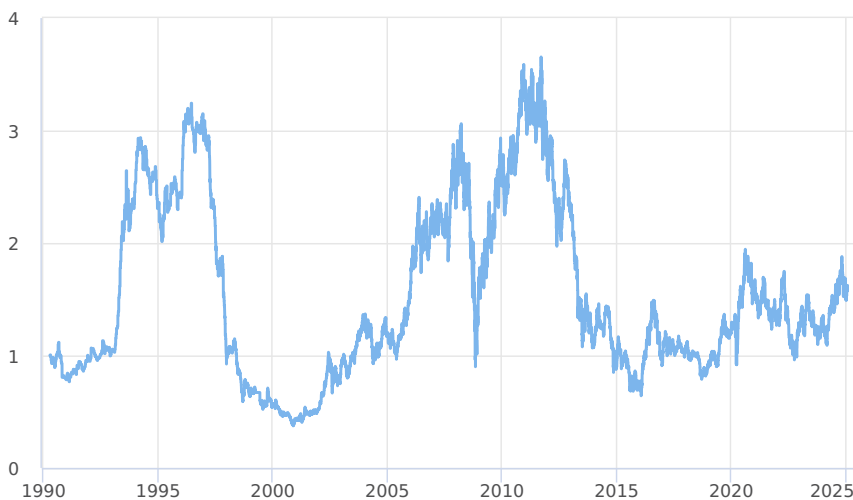
— CPR Invest - Global Gold Mines